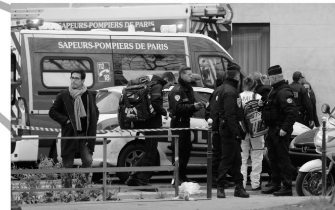
Überfall auf die Redaktion der Satire-Zeitschrift Charlie Hebdo am 7. Januar 2015.

Wer Mohamed-Karikaturen sieht, sieht auch andere Bilder mit.