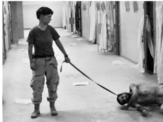
Folterbilder Abu Ghraib – gefangene Iraker wie Hunde an der Leine geführt, nicht nur für Muslime eine schlimme Demütigung. Geschehen 2003, veröffentlicht 2006 – zeitnah zu den Mohamed-Karikaturen.

Wer Mohamed-Karikaturen sieht, sieht auch andere Bilder mit.