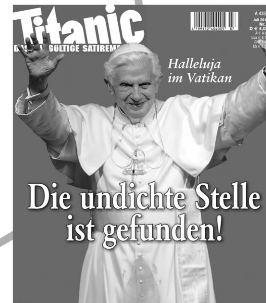
2. August 2012, 10:00 Uhr – Süddeutsche Zeitung – online Nach dem Willen des Bamberger Erzbischofs Ludwig Schick soll Gotteslästerung künftig unter Strafe gestellt werden.

Wir üben keine Zensur aus, auch nicht bei religiösen Karikaturen.